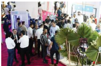
• نمایشگاه ساختمان تهران / ۱۴۰۲