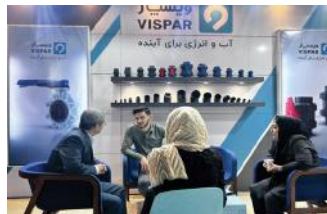
• نمایشگاه ساختمان مشهد / ۱۴۰۲