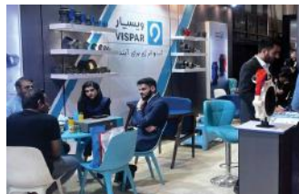
• نمایشگاه ساختمان شیراز / ۱۴۰۲