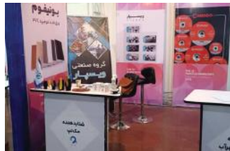
• نمایشگاه نانو فن آوری تهران / ۱۴۰۱