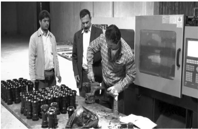
راه اندازی اولین دستگاه تزریق خط تولید / سال ۱۳۸۹

در مجموع در سطح استان تا آنجا که امکان داشته باشد، همکاری می‌شود؛ اما یک سری قوانین دست‌وپاگیر نیز وجود دارد که باید در سطح کلان و کشوری حل شود و هیچ ارتباطی به استان ندارد.