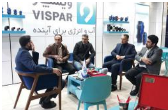
• نمایشگاه ساختمان قائم‌شهر / ۱۴۰۱