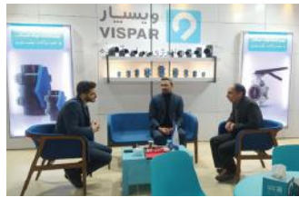
• نمایشگاه آب و فاضلاب تهران / ۱۴۰۱