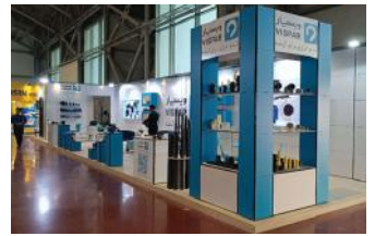
• نمایشگاه تاسیسات اصفهان / ۱۴۰۱