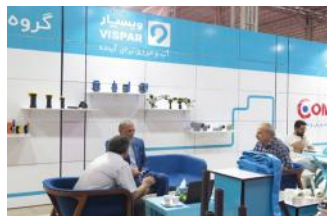
• نمایشگاه توانمندی‌های استان همدان / ۱۴۰۱