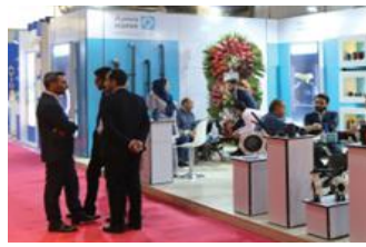
• نمایشگاه ساختمان تهران / ۱۴۰۱