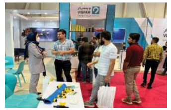
• نمایشگاه آبیاری شیراز / ۱۴۰۱