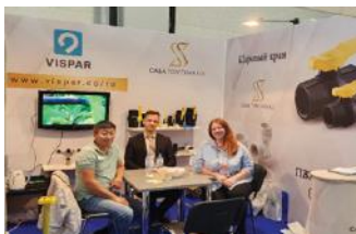
• نمایشگاه روسیه / ۲۰۲۲