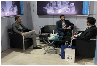
• نمایشگاه نفت و گاز تهران / ۱۴۰۱