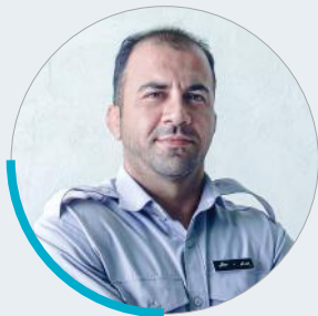
میثم صفایی قهرمان کشتی کشور: