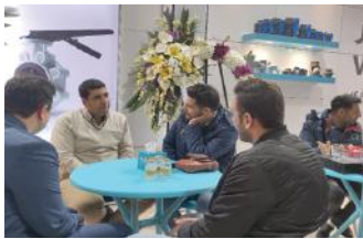
• نمایشگاه آبیاری تهران / ۱۴۰۱