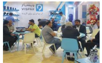
• نمایشگاه ساختمان تبریز / ۱۴۰۲