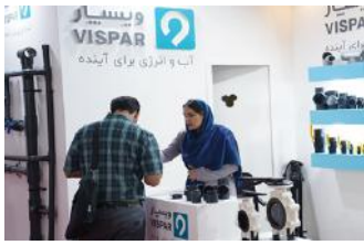
• نمایشگاه تاسیسات تهران / ۱۴۰۱