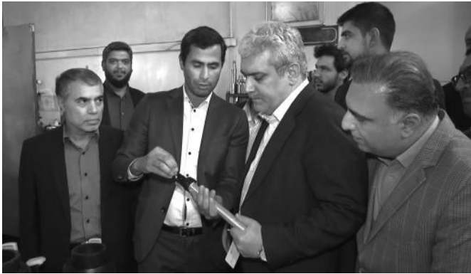
بازدید جناب آقای دکتر ستاری معاونت علمی و فناوری ریاست جمهور وقت