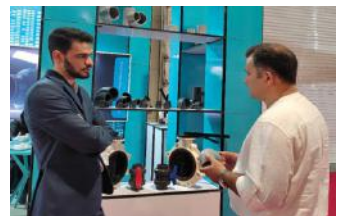
• نمایشگاه ساختمان مشهد / ۱۴۰۱