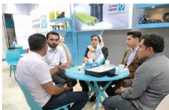
• نمایشگاه آبیاری شیراز / ۱۴۰۲