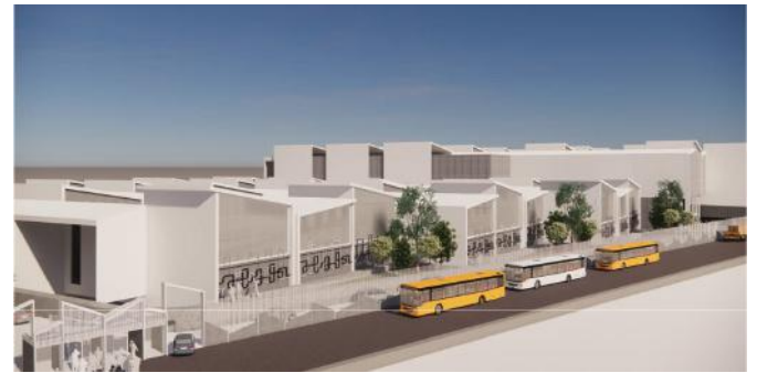
نمایی از پروژه طرح توسعه کارخانه گروه صنعتی ویسپار

از ۱۳۸۶/۱۲/۱۶ تا به امروز ۵۶۵۴ روز می‌گذرد. روزهایی که لحظه لحظه‌اش فکر تلاش و همکاری بوده، روزهایی که با آرزوها، موفقیت‌ها، شکست‌ها، غم‌ها و شادی‌ها همراه بوده.